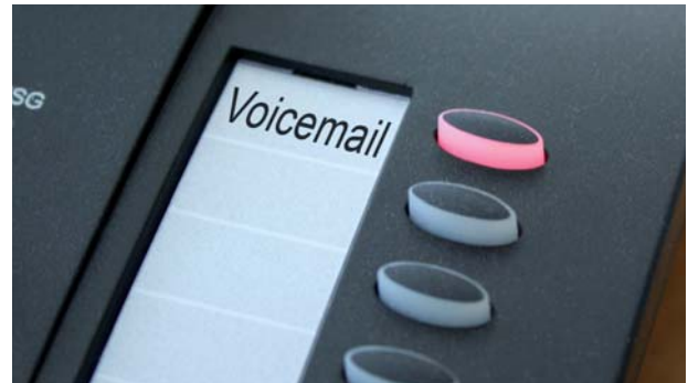
Sie haben eine Nachricht: Message Waiting Indication am innovaphone VoIP-Telefon IP240

Alle innovaphone IP-Telefone sowie das innovaphone WLAN-Telefon signalisieren durch Licht, Text oder mittels Symbol, dass eine Nachricht auf Sie wartet (Message-Waiting-Indication (MWI)). Auch Telefone von Drittherstellern – sofern SIP- oder H.323-basiert – zeigen an, dass eine Nachricht für Sie hinterlegt ist. Alternativ kann die Voice-Box so konfiguriert werden, dass eine E-Mail zugestellt wird, die den Empfänger über eine anliegende Nachricht informiert. Der E-Mail-Versand erfolgt wahlweise mit (als Wav-File) oder ohne die Nachricht selbst. Um diese Funktion zu nutzen,